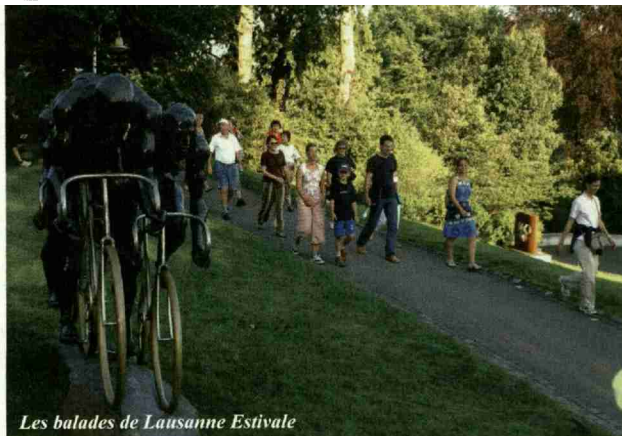
Les balades de Lausanne Estivale