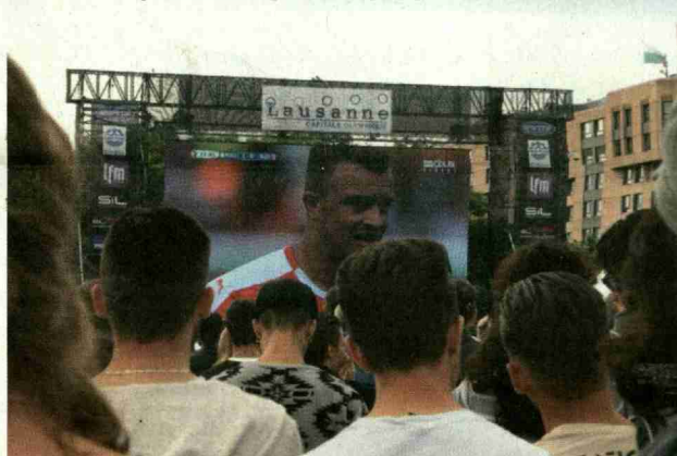
Euro 2016 : la place de la Navigation fait le plein par beau temps (ici le 16 juin)