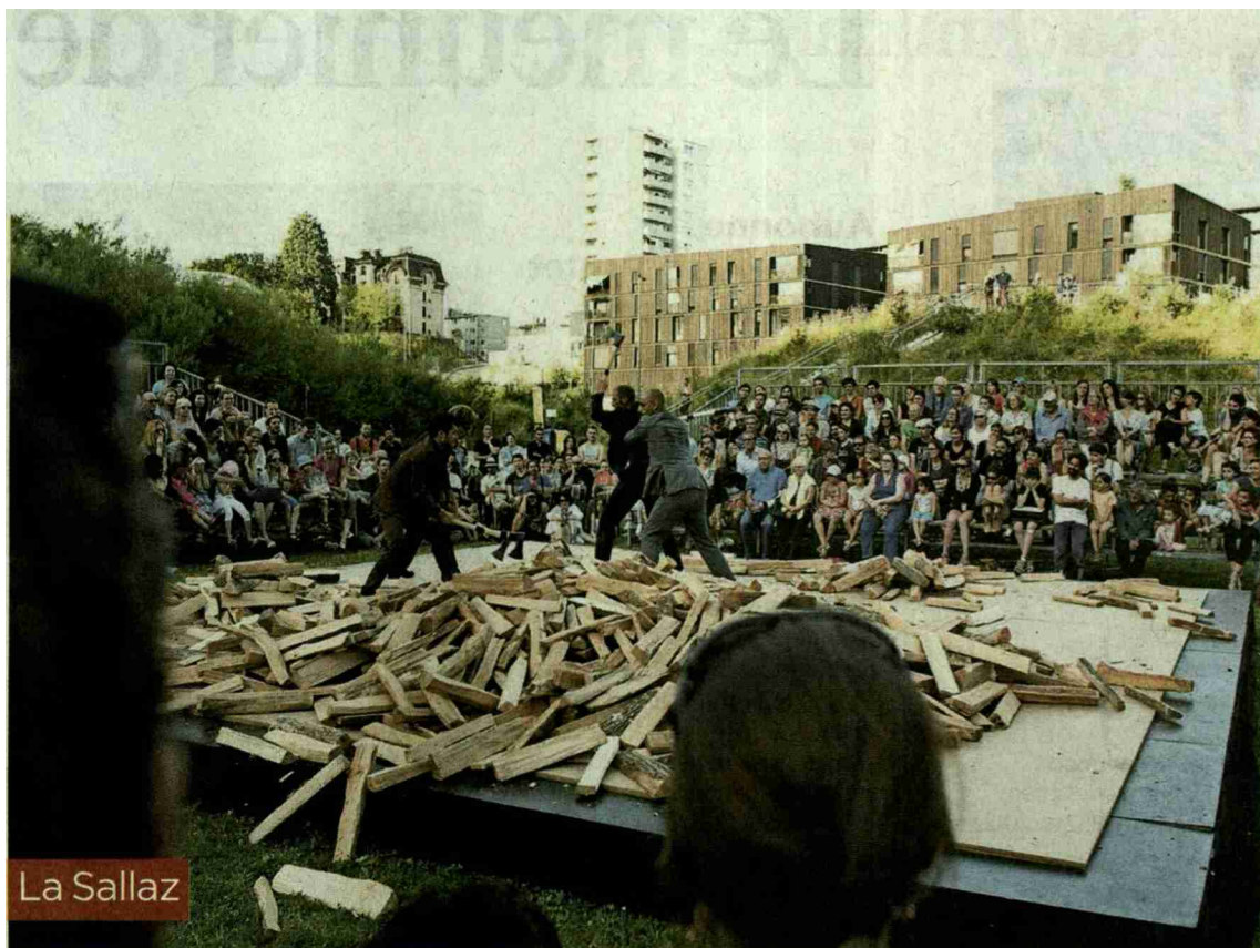
La foule s'est déplacée à la Clairière pour assister à «La Cosa» mardi et mercredi MARIUS AFFOLTER

N° de thème: 034.022 N° d'abonnement: 3003041 Page: 14 Surface: 125'987 mm 2