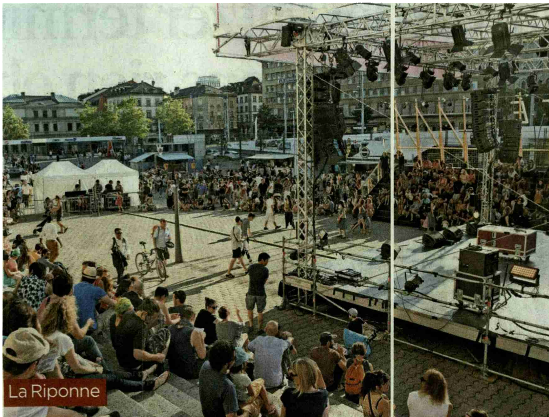
Début de soirée, mercredi. Le public attend les danseurs de Suave pour un freestyle.

N° de thème: 034.022 N° d'abonnement: 3003041 Page: 14 Surface: 125'987 mm 2